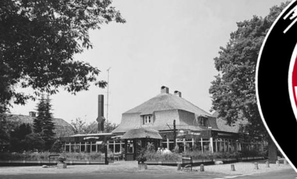
De Vuursche Boer